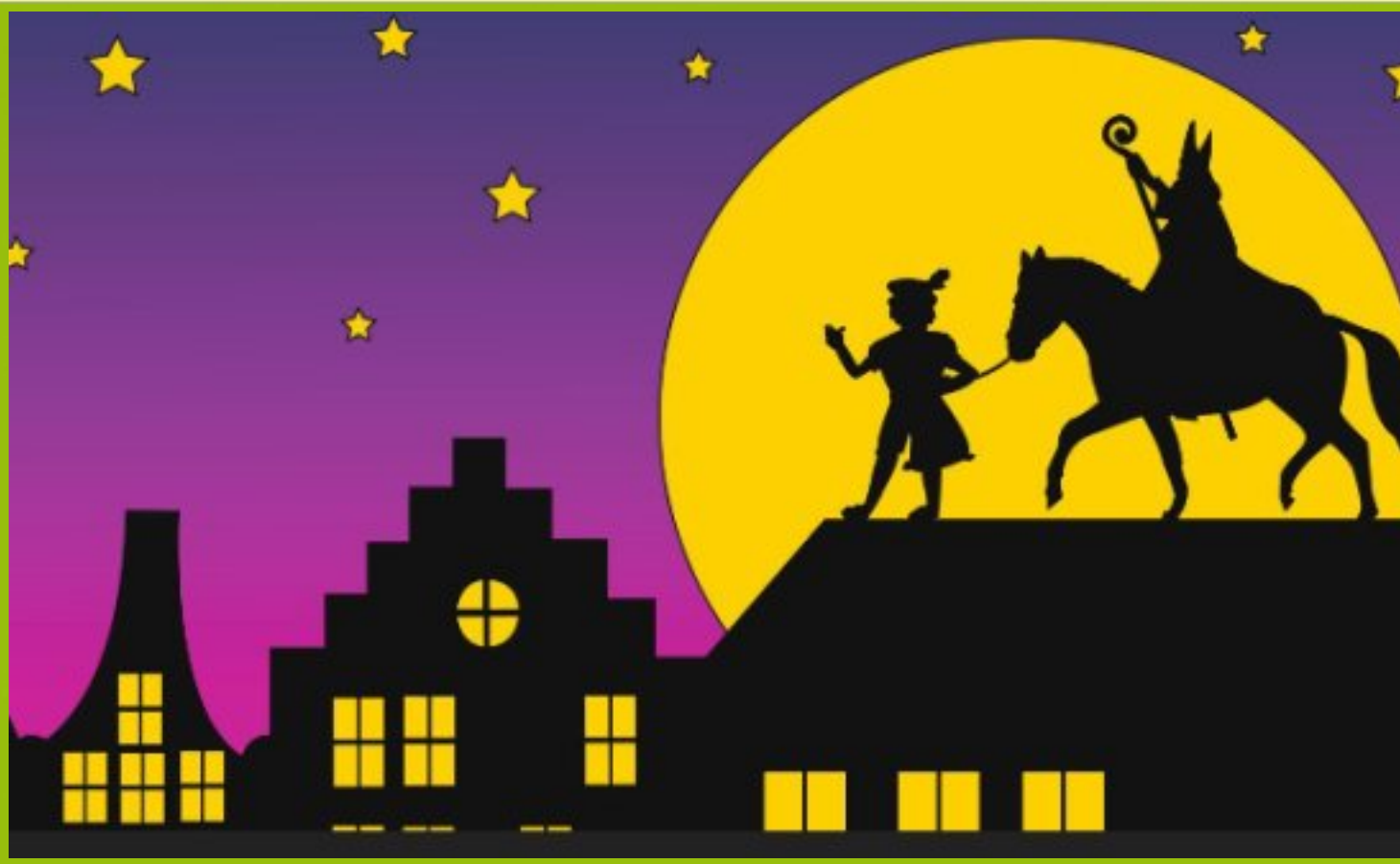
Schoentje gezet op de Willibrordschool.

De school was weer versierd en dat was heel gezellig en mooi. Op 3 December was de sint op school. En er zijn natuurlijk weer heel veel kruidnoten gegeten, ook chocoladeletters. We hadden ook schoentje gezet en daar kregen we een chocoladeletter en een lekker zakje met kruidnoten.